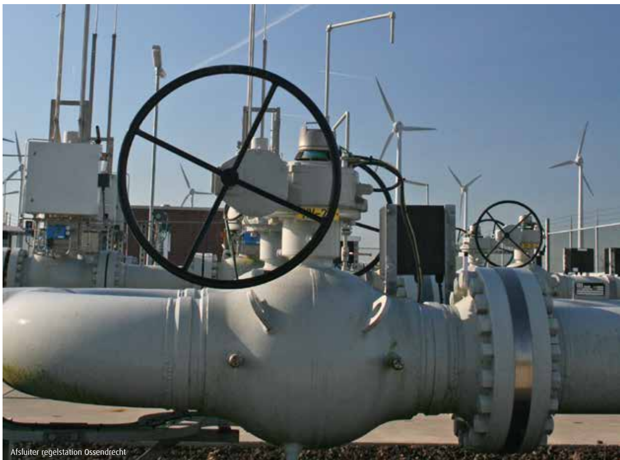
Afsluiter regelstation Ossendrecht

De vaste activa worden gewaardeerd op basis van de verkrijgingsprijs, verminderd met de over deze waarde berekende afschrijvingen. Afschrijvingen vinden plaats volgens het lineaire systeem.