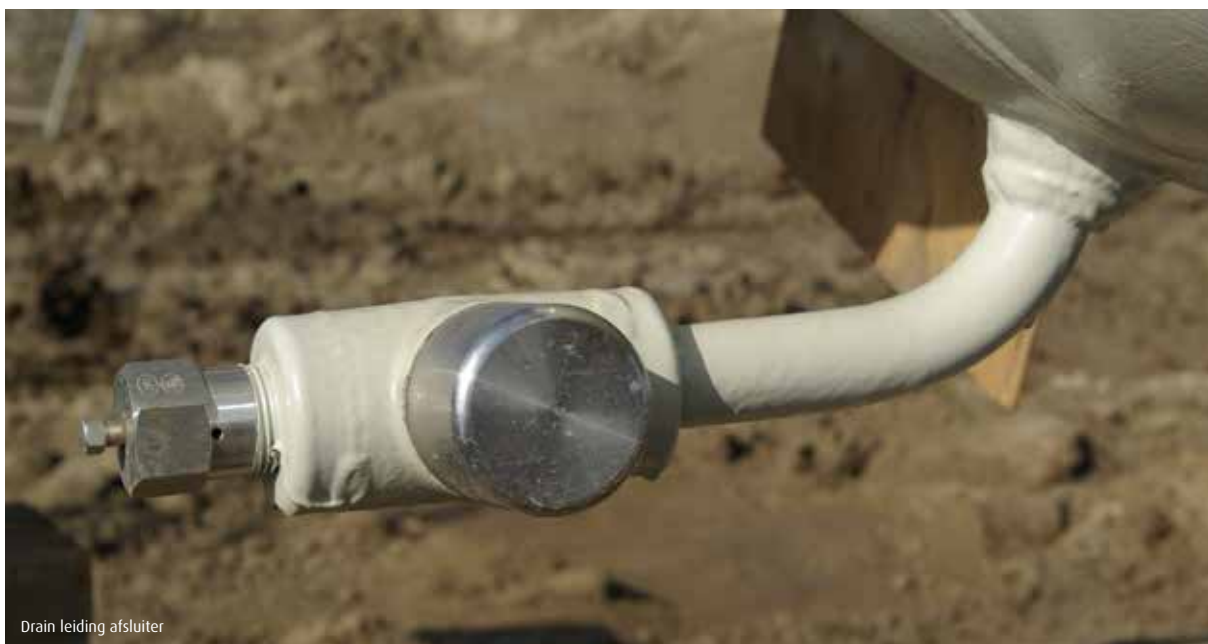
Drain leiding afsluiter

De vennootschap is belastingplichtig voor de vennootschapsbelasting. De berekening van de vennootschapsbelasting is gebaseerd op de geldende tariefstructuur, zijnde 20,0% over de eerste € 200.000 en 25,0% over het resterende fiscale resultaat. Daarnaast is bij de berekening van het fiscaal resultaat rekening gehouden met de door de Belastingdienst geboden faciliteiten.